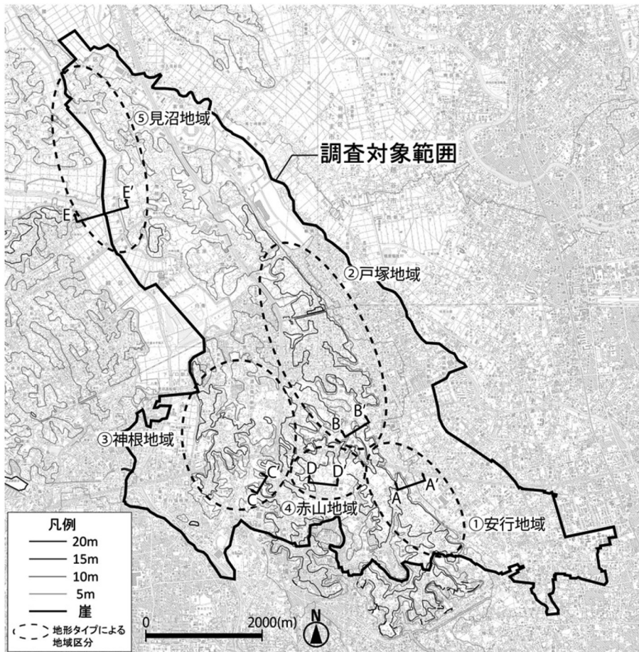
※図中の断面位置を示すアルファベットは図2内に表示したアルファベットに対応