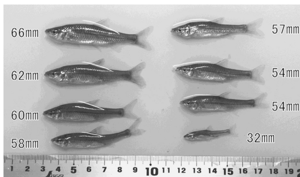
図 2 野付牛公園で採捕したモツゴ (数字は尾叉長を示す)