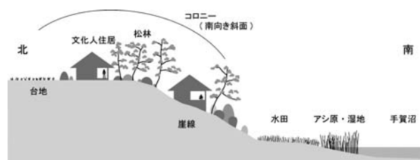
図2 コロニーの立地断面模式図

構成文化人住居は敷地前に水田があった中助助邸を除き、主に松林の中に存在していた。また、それらの構成文化人住居からは、樹木、水田を隔てて沼が広がる眺望景が眺められたと推察される(図2)。柳夫妻・バーナード・リーチ邸と嘉納治五郎別荘周辺は「左手の高台は、この地でおそらく、いちばん早くひらけた別荘地で、手賀沼を見下ろす絶好の地である。」 7) 、武者小路実篤邸周辺は「このあたりは落日の鑑賞にはまことにけっこうで、時には富士のシルエットを見ることができる。」 7) 、滝井孝作邸周辺は「この辺りから見る沼の夕景色は抜群であった。」 7) などと文献に記録されている。このことから、柳夫妻・バーナード・