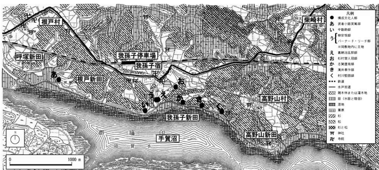
*1897 (明治30)年陸地測量部発行「2万分の1迅速測図 我孫子宿 取手駅 龍箇崎村」より作成